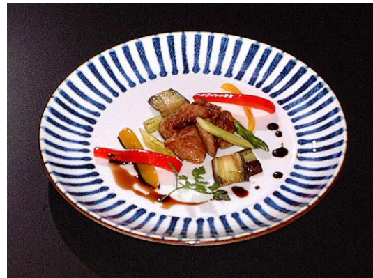
フォアグラと野菜のソテー ¥1,980