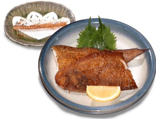
舌平目のムニエル ¥2,750