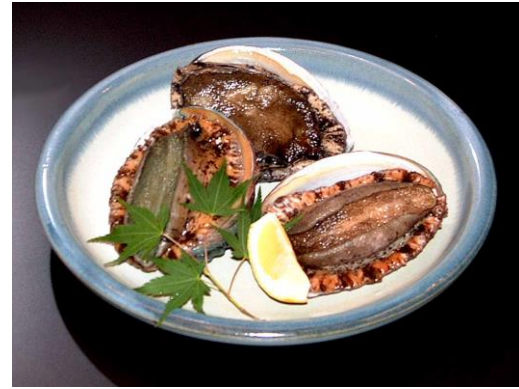
アワビのステーキ 時 価