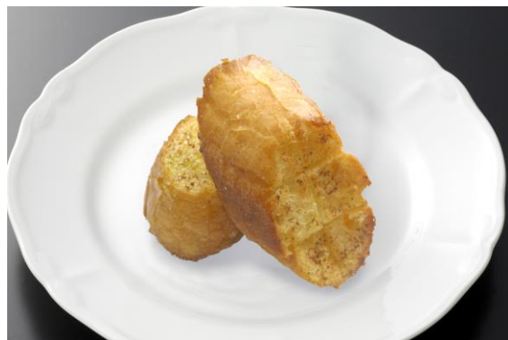
ガーリックトースト ¥550