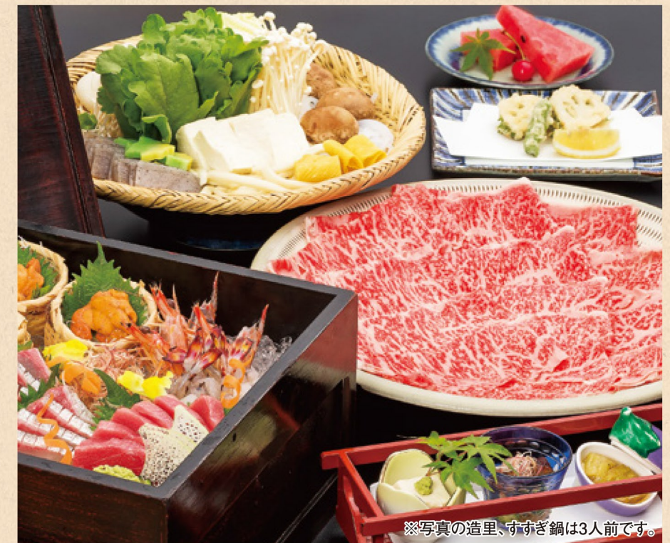
※写真の造里、すすぎ鍋は3人前です。

産地直送の車海老・滑らかな口どけのウニ・料理長厳選の旬の魚など海のお宝を詰め込んだ「海のお宝玉手箱」に名物「すすぎ鍋」同時に楽しんで頂ける期間限定のコース