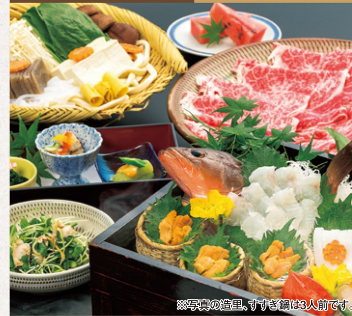
※写真の造里、すすぎ鍋は3人前です。