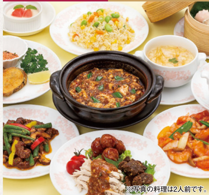
※写真の料理は2人前です。