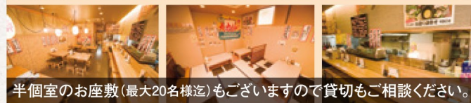
半個室のお座敷(最大20名様迄)もございますので貸切もご相談ください。

お料理のみもご用意 一人様 2,600円 ※上記価格に別途消費税を頂戴いたします。