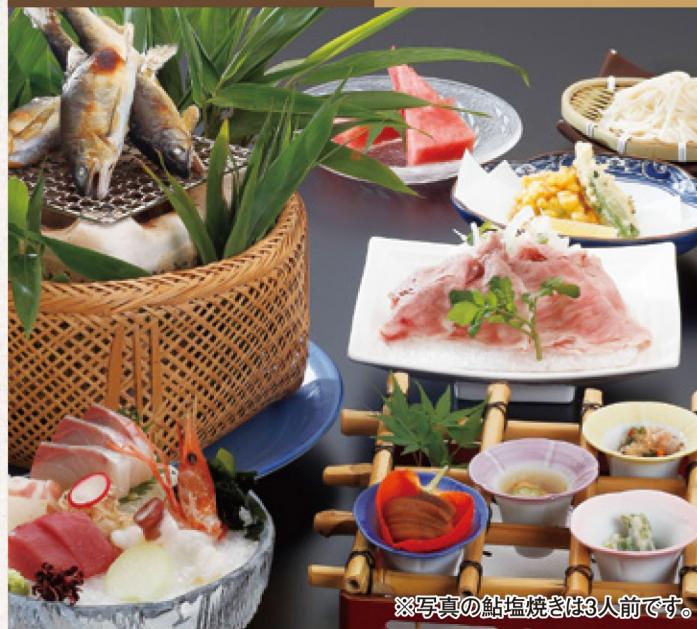
※写真の鮎塩焼きは3人前です。