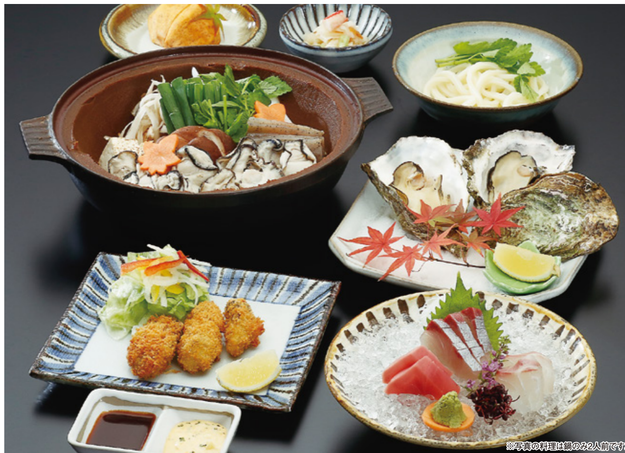
※写真の料理は鍋のみ2人前です。

【ひろしま八雲】1月5日(木)~30日(月) 【八雲流川店】1月10日(火)~2月18日(土)