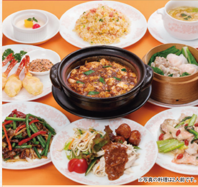
※写真の料理は2人前です。