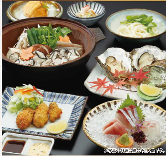
※写真の料理は鍋のみ2人前です。