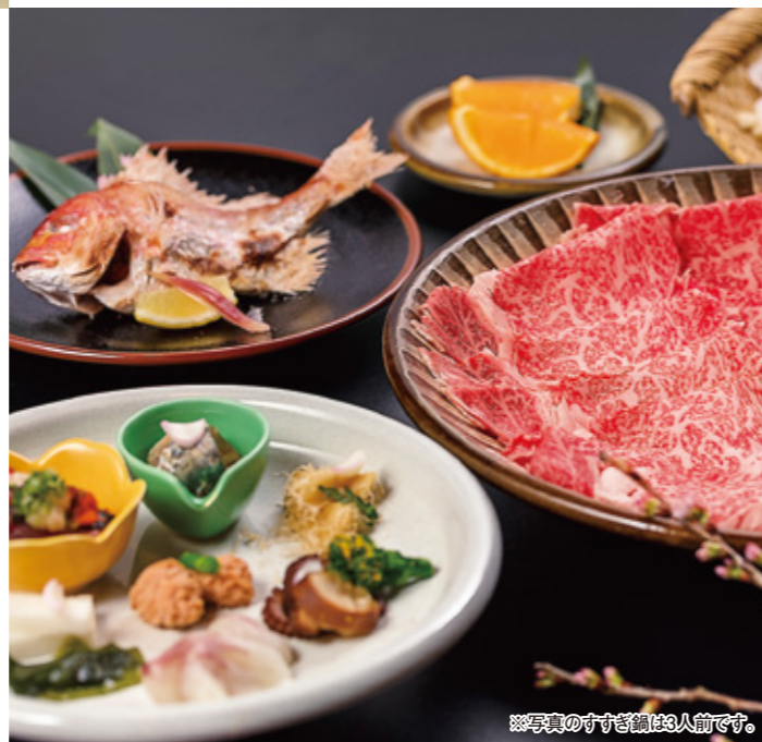
※写真のすすぎ鍋は3人前です。

TEL (082) 243-4500 広島市中区流川町1-24 第2味の館ビル1・2・3F 定休日 2日(日)、9日(日)、16日(日)、23日(日)、30日(日) 営業時間 【昼】11:00~15:00(L.O.14:00) 【夜】17:00~23:00(L.O.22:30) 【夜(祝日)】16:00~23:00(L.O.22:00) 提携駐車場有り