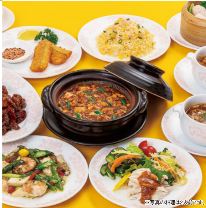
※写真の料理は2人前です。

TEL (082) 247-8801 広島市中区堀川町4-11 アサヒビル館2・3F 定休日 4日(火)、11日(火)、18日(火)、25日(火)