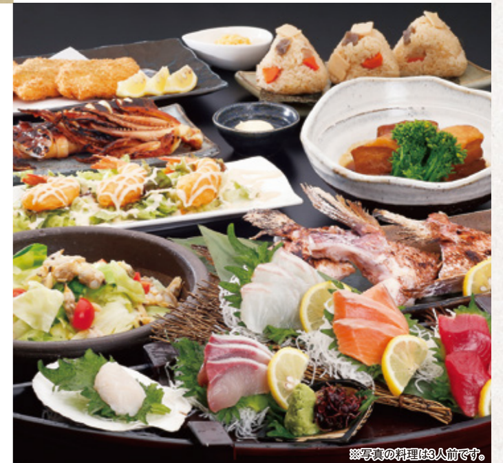
※写真の料理は3人前です。

TEL (082) 545-4137 広島市中区立町4-15 英万里ビル1F 定休日 2日(日)、9日(日)、16日(日)、23日(日)、30日(日)