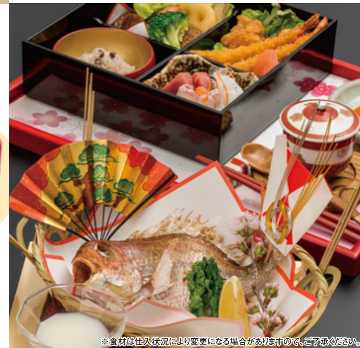
※食材は仕入状況により変更になる場合がありますので、ご了承ください。

※上記価格に別途消費税と、午後5時以降はご飲食代金の10%をサービス料として、個室ご利用の場合は10%をお部屋代として頂戴いたします。