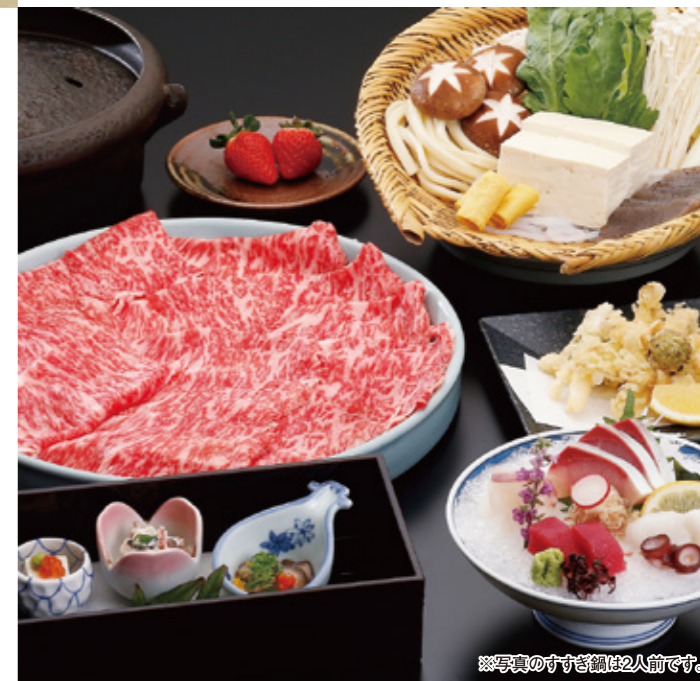
※写真のすすぎ鍋は2人前です。

TEL (082) 546-0008 広島市中区中町9-12 三井ガーデンホテル広島2F 定休日 3日(月)、10日(月)、17日(月)、24日(月) 営業時間 【昼】11:00~15:00(L.O.14:00) 【夜】17:00~23:00(L.O.22:00) 【夜(日・祝)】17:00~22:00(L.O.21:00) 提携駐車場有り