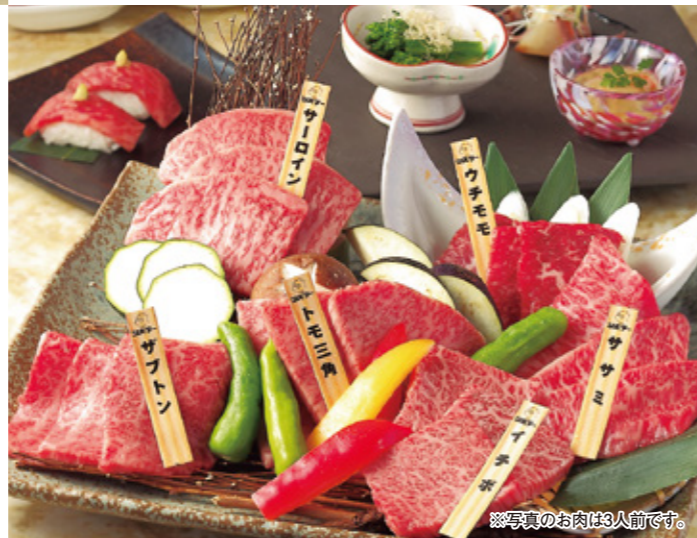
※写真のお肉は3人前です。

5月中はご来店された全てのお子様にサイコロくじを行います。 豪華景品もご用意してお待ちしております。