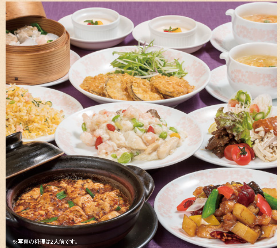
※写真の料理は2人前です。