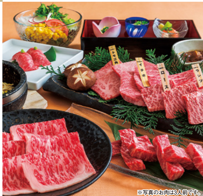
※写真のお肉は3人前です。