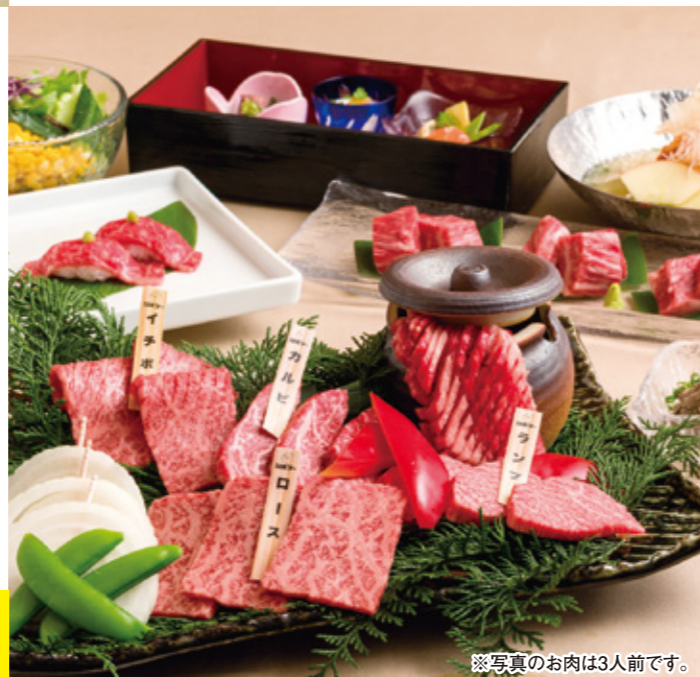
※写真のお肉は3人前です。