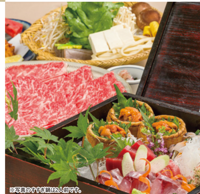
※写真のすずぎ鍋は2人前です。

TEL (082) 244-1551 広島市中区富士見町4-9 広越本社ビル1・2F 定休日 1日(火)、8日(火)、22日(火)、29日(火) 8月15日(火)は営業いたします