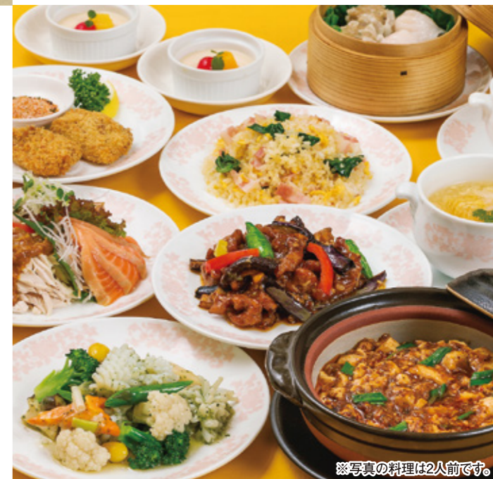
※写真の料理は2人前です。

TEL (082) 247-8801 広島市中区堀川町4-11 アサヒビル館2・3F 定休日 1日(火)、8日(火)、22日(火)、29日(火) 8月15日(火)は営業いたします