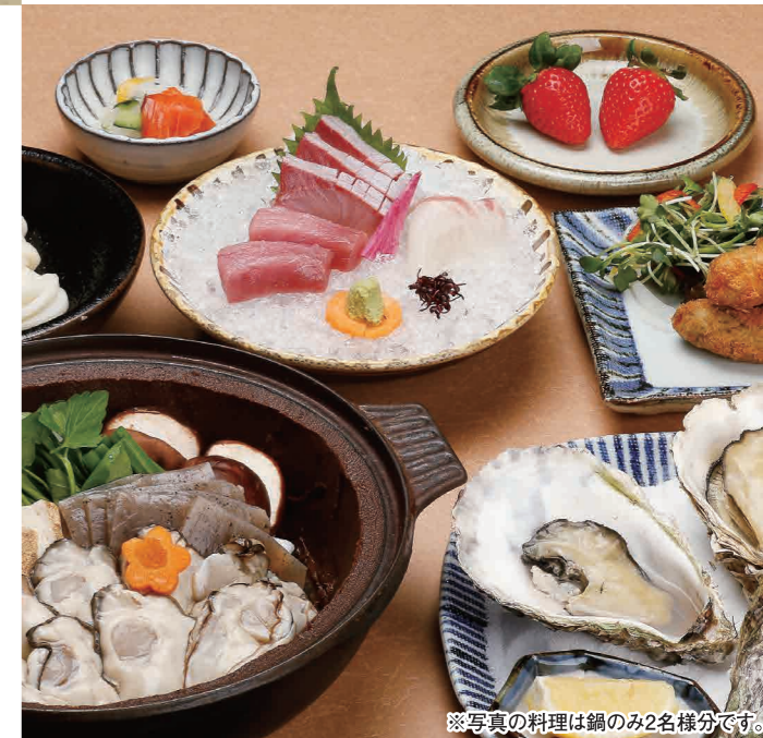
※写真の料理は鍋のみ2名様分です。

TEL (082) 243-4500 広島市中区流川町1-24 第2味の館ビル1・2・3F 定休日 4日(日)、12日(祝)、18日(日)、25日(日) 営業時間 【昼】11:00~15:00(ラストオーダー 14:00) 【夜】17:00~23:00(ラストオーダー 22:30) 【夜(祝日)】16:00~23:00(ラストオーダー 22:00) 提携駐車場有り