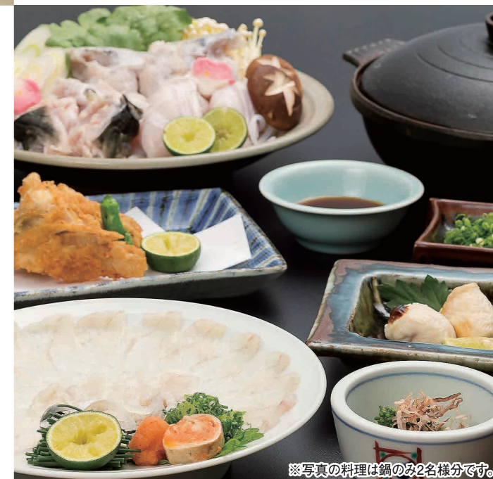
※写真の料理は鍋のみ2名様分です。

TEL (082) 244-1551 広島市中区富士見町4-9 広越本社ビル1・2F 定休日 6日(火)、13日(火)、20日(火)、27日(火) 営業時間 【昼】11:00~16:00(ラストオーダー 15:00) 【夜】17:00~23:00(ラストオーダー 22:00) 【夜(日・祝)】17:00~22:00(ラストオーダー 21:00) 駐車場有り 広島牛指定店