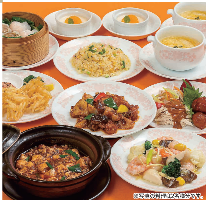
※写真の料理は2名様分です。

TEL (082) 247-8801 広島市中区堀川町4-11 アサヒビル館2・3F 定休日 6日(火)、13日(火)、20日(火)、27日(火) 営業時間 【昼】11:30~15:00(ラストオーダー 14:30) 【夜】17:00~23:00(ラストオーダー 22:30) 【夜(日・祝)】17:00~22:00(ラストオーダー 21:30)