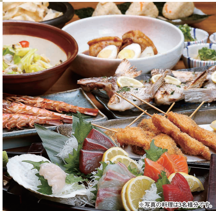
※写真の料理は3名様分です。

TEL (082) 545-4137 広島市中区立町4-15 英万里ビル1F 定休日 4日(日)、11日(日)、18日(日)、25日(日)