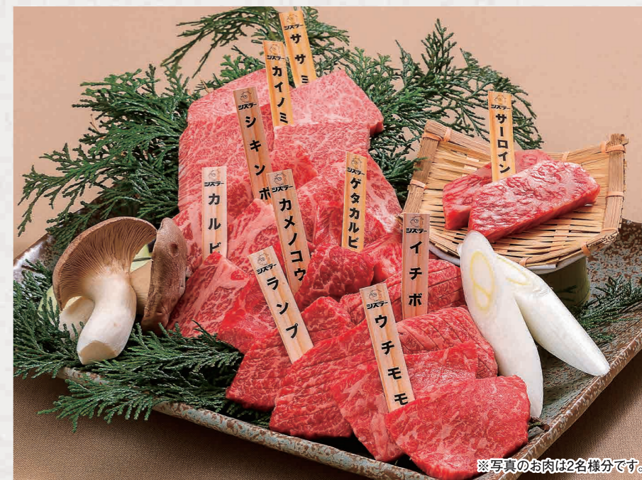
※写真のお肉は2名様分です。

TEL (082) 242-4129 広島市中区富士見町4-9 広越本社ビル4F 定休日 1日(木)、8日(木)、15日(木)、22日(木)、29日(木) 駐車場有り 営業時間 【昼】11:00~15:00(ラストオーダー 14:30) 【夜】17:00~23:00(ラストオーダー 22:00) 【夜(日・祝)】17:00~22:00(ラストオーダー 21:00) 広島牛指定店