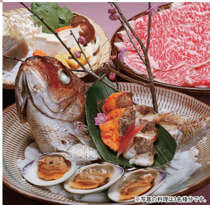
※写真の料理は3名様分です。

TEL (082) 243-4500 広島市中区流川町1-24 第2味の館ビル1・2・3F 定休日 4日(日)、11日(日)、18日(日)、25日(日)