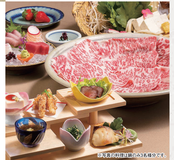
※写真の料理は鍋のみ3名様分です。

TEL (082) 244-1551 広島市中区富士見町4-9 広越本社ビル1・2F 定休日 6日(火)、13日(火)、20日(火)、27日(火)