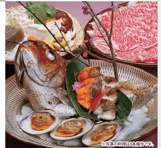
※写真の料理は3名様分です。

TEL (082) 243-4500 広島市中区流川町1-24 第2味の館ビル1・2・3F 定休日 1日(日)、8日(日)、15日(日)、22日(日)、30日(祝)