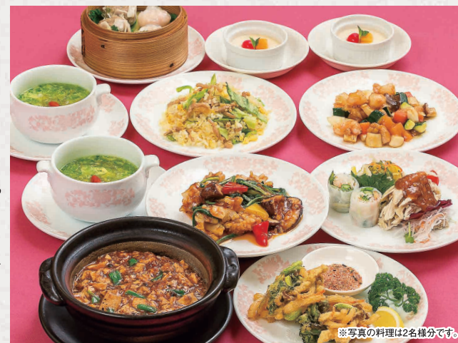
※写真の料理は2名様分です。

TEL (082) 247-8801 広島市中区堀川町4-11 アサヒビル館2・3F 定休日 3日(火)、10日(火)、17日(火)、24日(火)