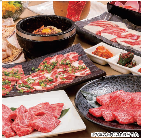
※写真のお肉は3名様分です。

TEL (082) 242-4129 広島市中区富士見町4-9 広越本社ビル4F 定休日 5日(木)、12日(木)、19日(木)、26日(木)