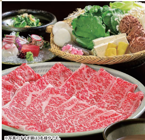
※写真のすずぎ鍋は3名様分です。

TEL (082) 244-1551 広島市中区富士見町4-9 広越本社ビル1・2F 定休日 5日(火)、12日(火)、19日(火)、26日(火)