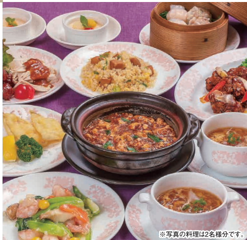
※写真の料理は2名様分です。

TEL (082) 247-8801 広島市中区堀川町4-11 アサヒビル館2-3F 定休日 5日(火)、12日(火)、19日(火)、26日(火)