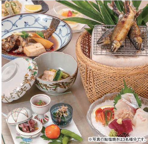
※写真の鮎塩焼きは3名様分です。

TEL (082) 546-0008 広島市中区中町9-12 三井ガーデンホテル広島2F 定休日 4日(月)、11日(月)、18日(月)、25日(月)