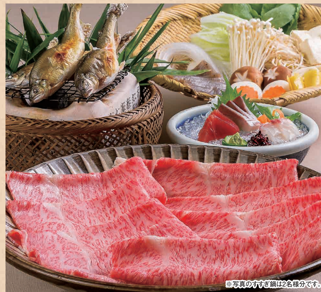
※写真のすすぎ鍋は2名様分です。