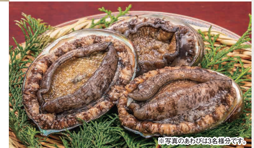
※写真のあわびは3名様分です。