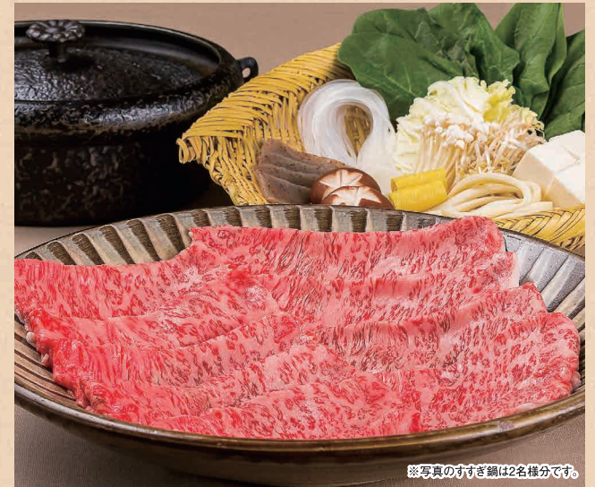
※写真のすずぎ鍋は2名様分です。