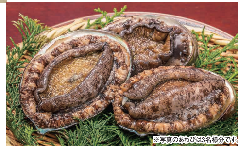
※写真のあわびは3名様分です。