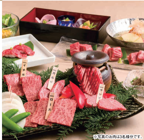
※写真のお肉は3名様分です。

TEL (082) 242-4129 広島市中区富士見町4-9 広越本社ビル4F 定休日 5日(木)、12日(木)、19日(木)、26日(木) 営業時間 【昼】11:00~15:00(ラストオーダー 14:30) 【夜】17:00~23:00(ラストオーダー 22:00) 【夜(日・祝)】17:00~22:00(ラストオーダー 21:00) 駐車場有り 広島牛指定店