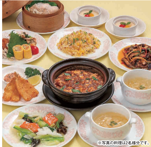
※写真の料理は2名様分です。

TEL (082) 247-8801 広島市中区堀川町4-11 アサヒビル館2・3F 定休日 3日(火)、10日(火)、17日(火)、24日(火)、31日(火) 営業時間 【昼】11:30~15:00(ラストオーダー 14:30) 【夜】17:00~23:00(ラストオーダー 22:30) 【夜(日・祝)】17:00~22:00(ラストオーダー 21:30)