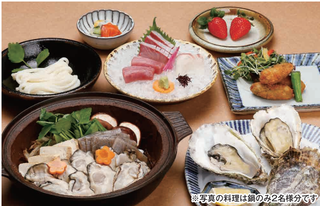
※写真の料理は鍋のみ2名様分です

※上記価格に別途消費税と、午後5時以降はご飲食代金の10%をサービス料として、個室ご利用の場合は10%をお部屋代として頂戴いたします。