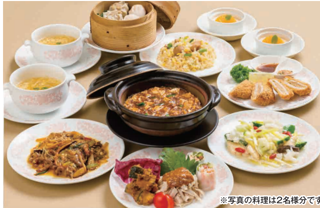
※写真の料理は2名様分です

※上記価格に別途消費税と、午後5時以降はご飲食代金の10%をサービス料として頂戴いたします。