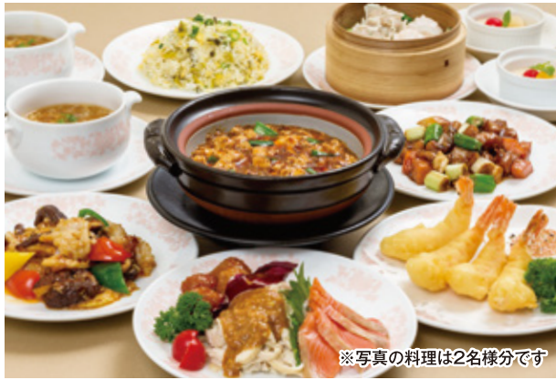
※写真の料理は2名様分です

TEL (082) 247-8801 広島市中区堀川町4-11 アサヒビル館2・3F