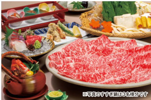
※写真のすすぎ鍋は3名様分です

TEL (082) 244-1551 広島市中区富士見町4-9 広越本社ビル1・2F