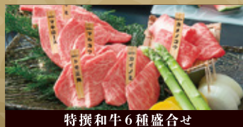
特撰和牛6種盛合せ