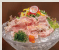
ひろしま八雲 特製 冷やし肉