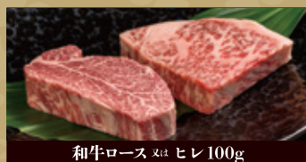
和牛ロース 又は ヒレ100g