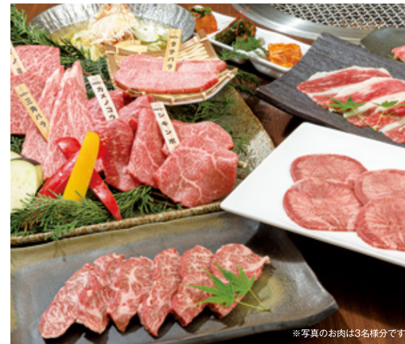
※写真のお肉は3名様分です