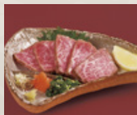
味味亭 特製 コールドステーキ