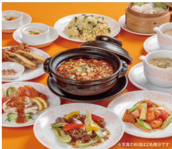
※写真の料理は2名様分です

【昼】11:30~15:00(ラストオーダー 14:30) 【夜】17:00~23:00(ラストオーダー 22:00) 【夜(日・祝)】17:00~22:00(ラストオーダー 21:00) 8月の店休日/4日.11日.18日.25日