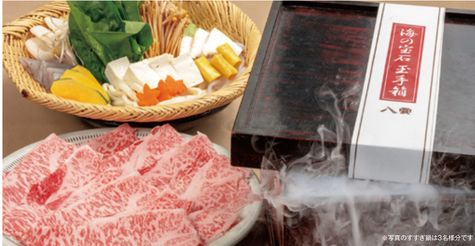
※写真のすすぎ鍋は3名様分です

【昼】11:00~15:00(ラストオーダー 14:30) 【夜】17:00~23:00(ラストオーダー 22:00) 【夜(日・祝)】17:00~22:00(ラストオーダー 21:00) 8月の店休日/4日.11日.18日.25日