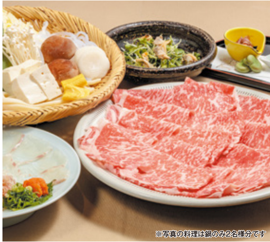
※写真の料理は鍋のみ2名様分です

【昼】11:00~15:00(ラストオーダー 14:30) 【夜】17:00~23:00(ラストオーダー 22:00) 【夜(日・祝)】17:00~22:00(ラストオーダー 21:00) 3月の店休日/2日.8日.9日.16日.23日.30日