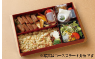
※写真はロースステーキ弁当です

特選黒毛和牛カットファイル ステーキ弁当 5,500円 (税込) 特選黒毛和牛ロース ステーキ弁当 5,000円 (税込)