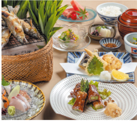
安芸コース お一人様 6,050円

【昼】11:00~15:00(ラストオーダー 14:00) 【夜】17:00~23:00(ラストオーダー 22:00) 6月の店休日/1日.6日.7日.13日.20日.27日 ※1日は時間短縮要請を受け、休業させていただきます。