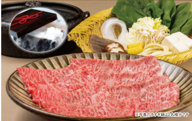
※写真のすき鍋は2名様分です