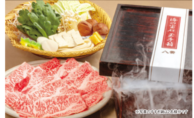
※写真のすき鍋は2名様分です