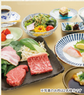
※写真のお肉は2名様分です