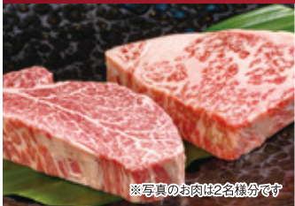
※写真のお肉は2名様分です