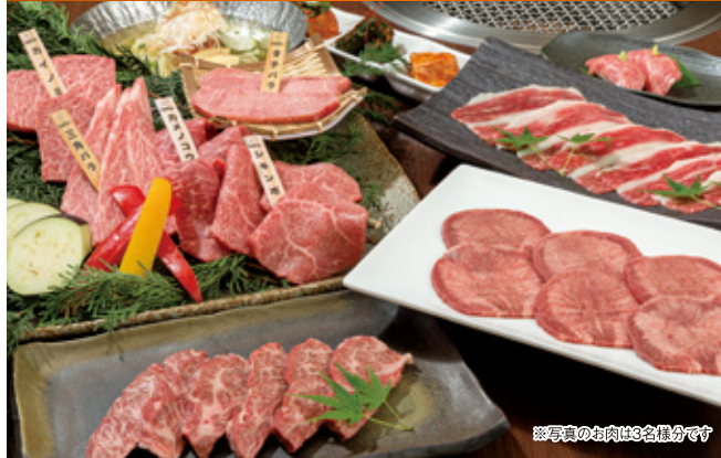
※写真のお肉は3名様分です