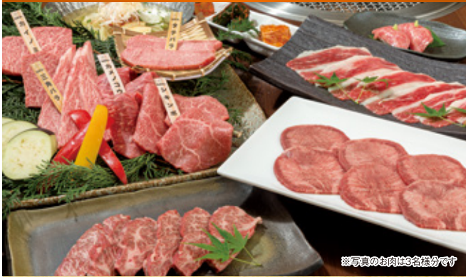
※写真のお肉は3名様分です